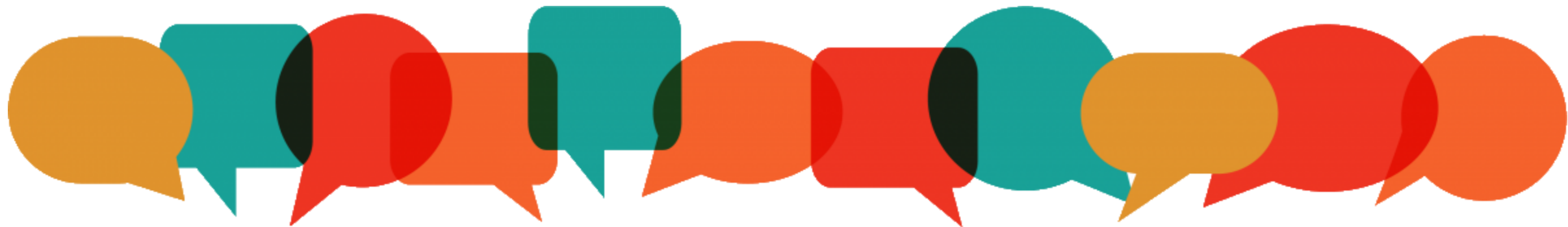
Plate-forme CFMS se former à tout moment